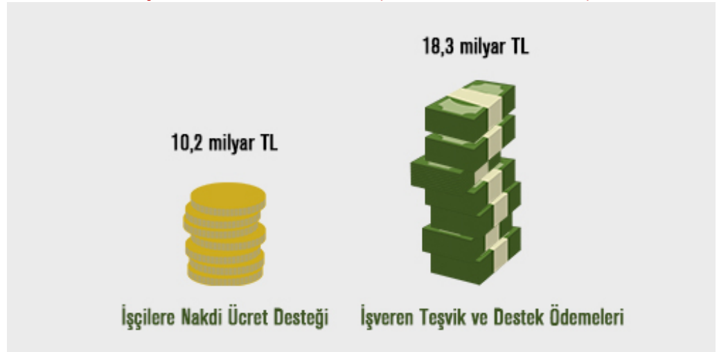
Grafik 1: İŞKUR'dan İşçilere Yapılan Nakdi Ücret Desteği ile İşverenlere Yapılan Teşvik ve Destek Ödemeleri (Nisan 2020-Mart 2021)